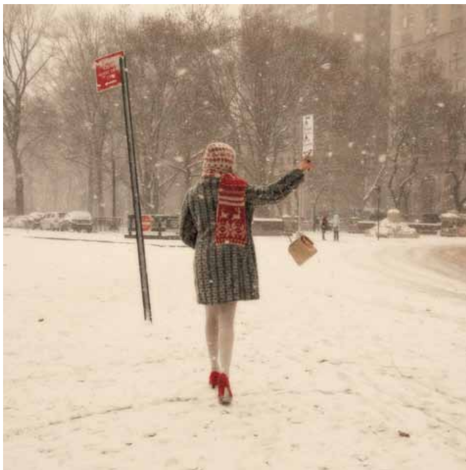
New York, 2010 Stampa Giclée su carta Hahnemühle, montata su pannello d-bond 100x100 cm Formato di stampa libero, tiratura complessiva 1/9 - N. 2 prove d'autore