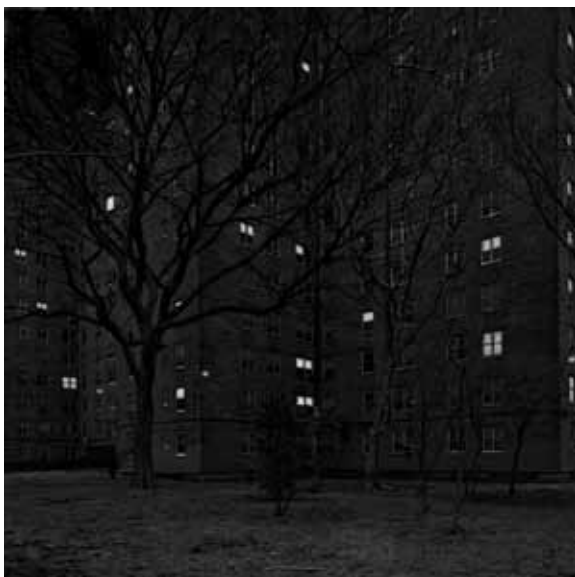
New York, 2010 Stampa Giclée su carta Hahnemühle, montata su pannello d-bond 100x100 cm Formato di stampa libero, tiratura complessiva 1/9 - N. 2 prove d'autore