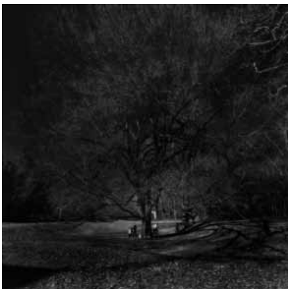
New York, 2010 Stampa Giclée su carta Hahnemühle, montata su pannello d-bond 100x100 cm Formato di stampa libero, tiratura complessiva 1/9 - N. 2 prove d'autore