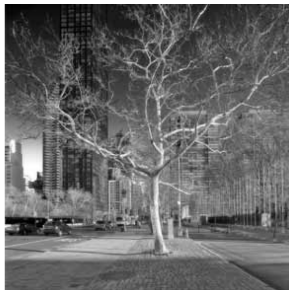
New York, 2010 Stampa Giclée su carta Hahnemühle, montata su pannello d-bond 100x100 cm Formato di stampa libero, tiratura complessiva 1/9 - N. 2 prove d'autore