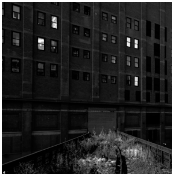
New York, 2010 Stampa Giclée su carta Hahnemühle, montata su pannello d-bond 100x100 cm Formato di stampa libero, tiratura complessiva 1/9 - N. 2 prove d'autore