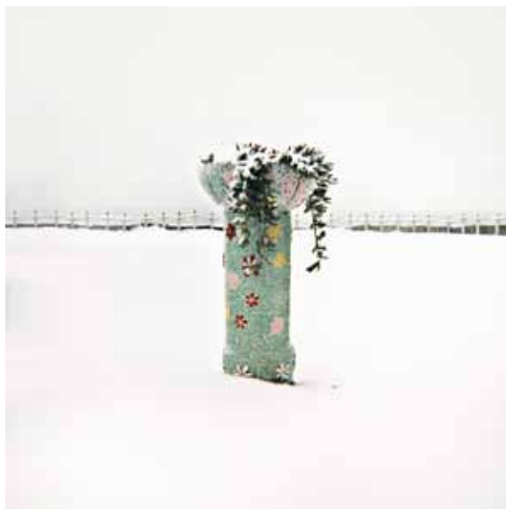
Mare di silenzio, 2005 Stampa Giclée su carta Hahnemühle, montata su pannello d-bond 100x100 cm Formato di stampa libero, tiratura complessiva 1/9 - N. 2 prove d'autore