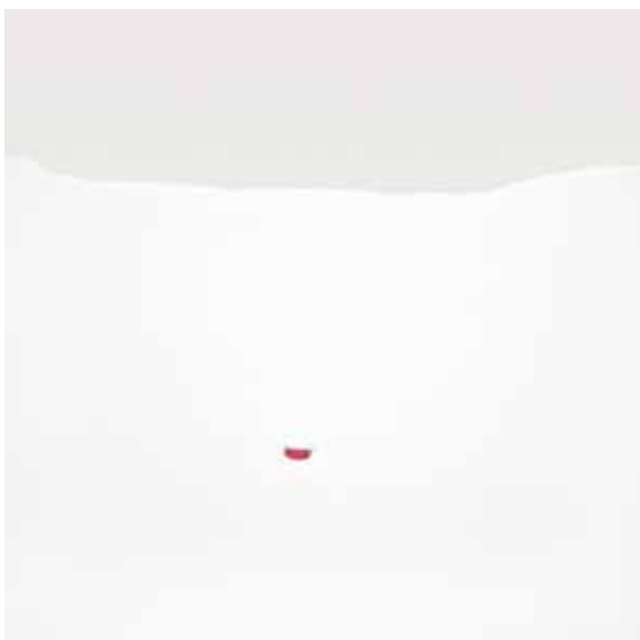
Mare di silenzio, 2005 Stampa Giclée su carta Hahnemühle, montata su pannello d-bond 100x100 cm Formato di stampa libero, tiratura complessiva 1/9 - N. 2 prove d'autore